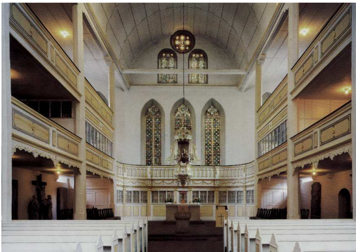
Arnstadt, Bachkirche, Inneres nach Ost, Foto Postcard KV Peda

Besonders zu erwähnen ist hier die Entscheidung, die seitlichen Galerien der Kapelle zu entfernen. Diese verliefen einst in zwei Ebenen übereinander. Beginnend von der hinteren Empore führten sie entlang der Außenwände bis in den Chorraum. Aufgrund der Umplanung wurde die untere Galerie entfernt, wodurch der Typus der ehemaligen "Predigtkirche" endgültig aufgegeben wurde.