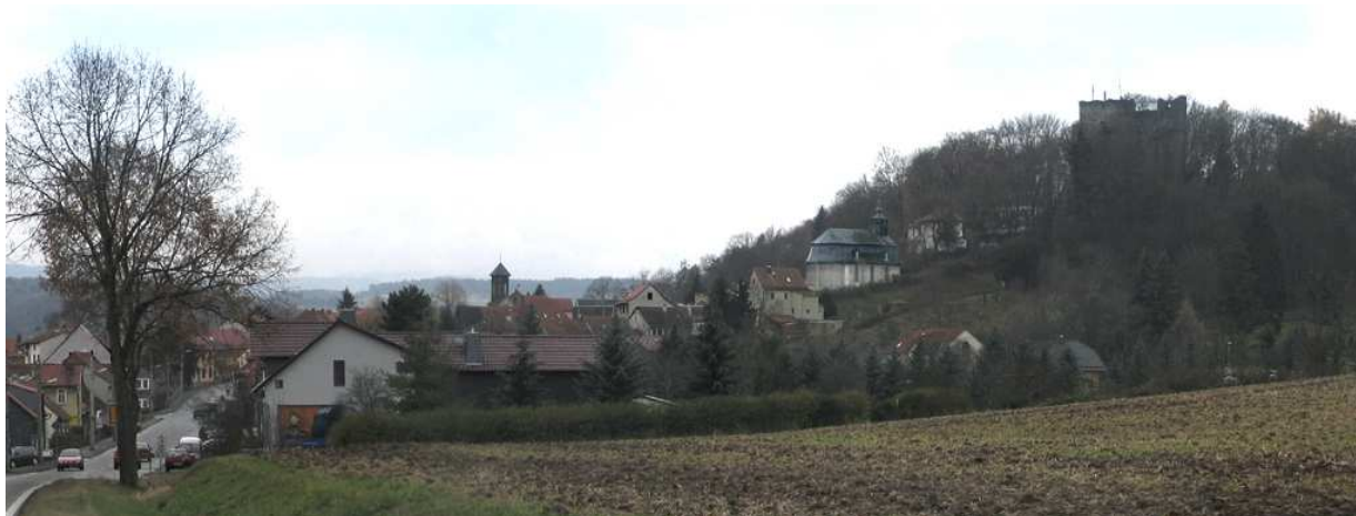
Plaue, Panorama von Nord

aber lebhaft, unterbrochen von einzelnen Reparaturstellen. Die Farbigekeit lebt aus einem leichten Kontrast der Putzflächen gegen den blassroten Naturton der Sandsteingewände der Wandöffnungen. Das tadellose Schieferdach rundet die fein abgestimmte Palette ab. Der blaugraue Grundton des Materials bringt wegen der natürlichen Nuancen des Steines eine beruhigende Härte in die Farbskala von sonst warmen Tönen. Ausgleichend wirkt der durch die Jahre zunehmende grüne Schleier des zunächst kaum auffallenden Moooses, das sich wie ein Hauch auf den Steinflächen ausbreitet.