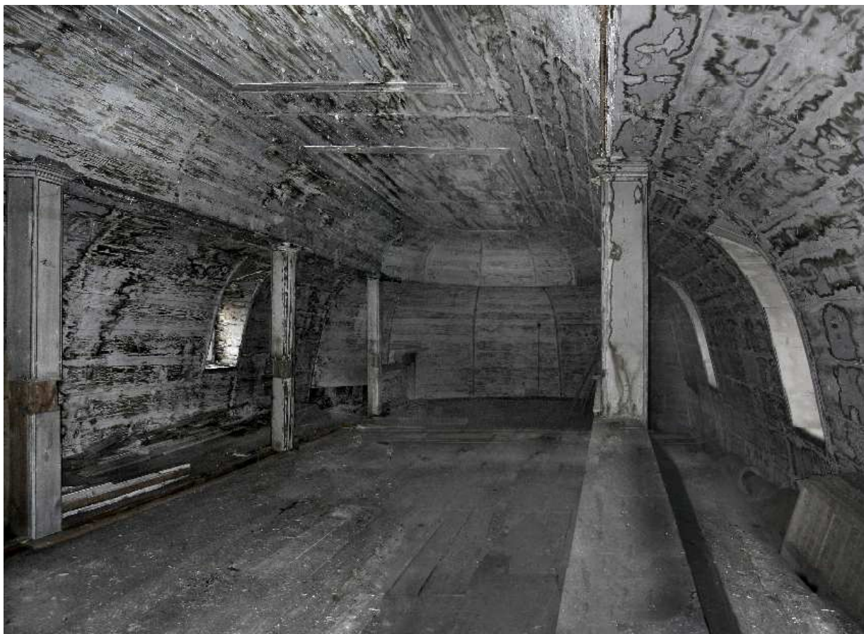
Plauë, ehemalige Kapelle St. Sigismund, 2. Emporenebene, Zustand 11/2004

Im Süden führt eine steile schmale Treppe in das nächste, das vermeintliche Dachgeschoss. Erstaunt ist man allerdings, wenn man nach dem Aufstieg feststellt, dass sich auf dieser Ebene eine weitere Empore befindet, die durch die neue Decke darunter verdeckt worden ist und bei den Umbauarbeiten nicht entfernt wurde. Man kann aus den verbliebenen Resten unschwer das frühere Konzept der Kapelle und vor allem des ehemaligen Innenraumes erkennen, das zweifelsfrei nach dem vorstehend besprochenen Typus der protestantischen Predigerkirche folgt. Die Affinität zur Bachkirche in Arnstadt ist offensichtlich.