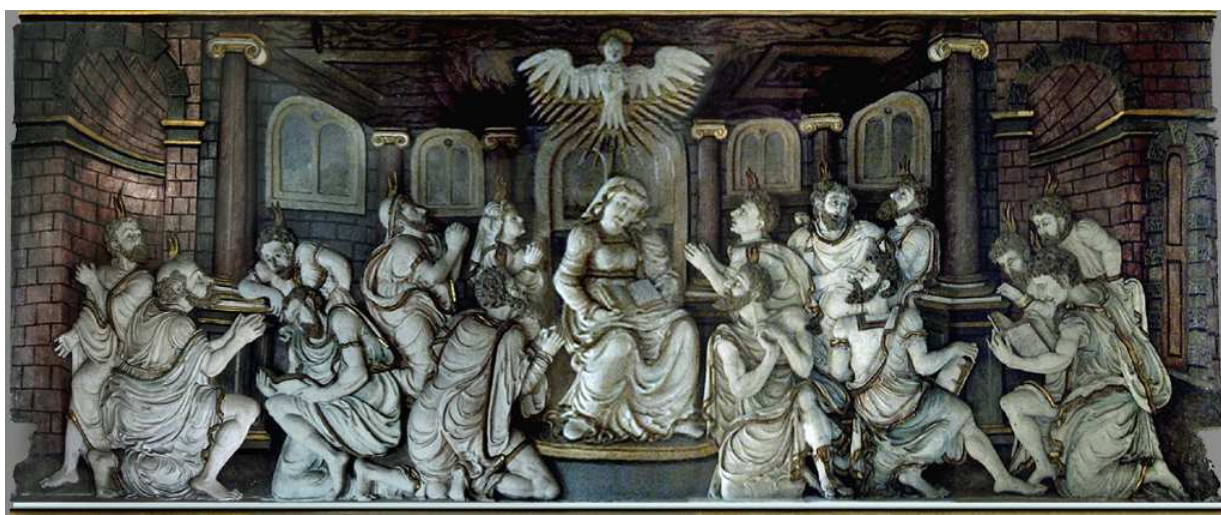
Fotografische Abwicklung des Kanzelreliefs, LR