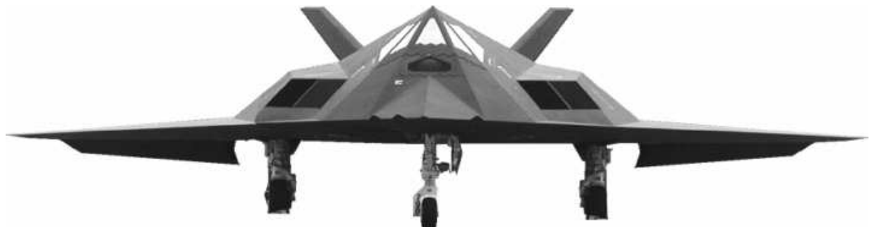
Stealth der Kampfflieger über der arabischen Wüste

Es folgte ein Hinweis auf die Ausstellungseröffnung am nächsten Tage, Dank und Verabschiedung